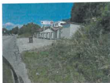
pohľad z Pezinskej ulice