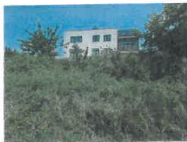
RD na p.č.5325/21